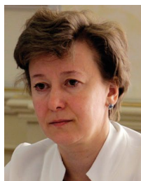
Вероника Никишина Министр ЕЭК