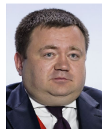
Петр Фрадков Генеральный директор АО «Российский экспортный центр»