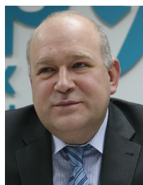
Александр Гребенчиков Первый заместитель губернатора Ростовской области