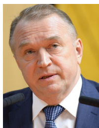
Сергей Катирин Президент Торгово-промышленной палаты РФ